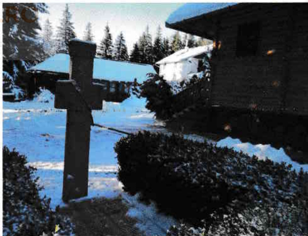
Vechiul schit ctitorit de vlădica Nicolae Bălan

Gerul s-a mai domolit, așa că o iau la pas pe un drum meag precum o uliță înzăpezită, gândind cum să îmi împart îmbucuratele clipe între bătrânul schit și casa în care a locuit o vreme filosoful Constantin Noica. Indiferent de drum, peisajul rămâne neschimbat, iar gândurile mă ajută să pășesc într-o fascinantă lume a cuvântului, a gândirii de dincolo de cuvânt.